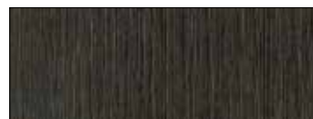
Rovere Fossile Intarsio RI11