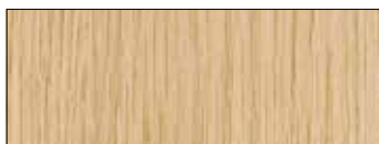
Rovere Nordico Intarsio RI09