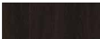
Rovere Termocotto Intarsio RI86