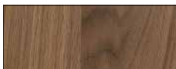
Noce Desaturato Intarsio RI90