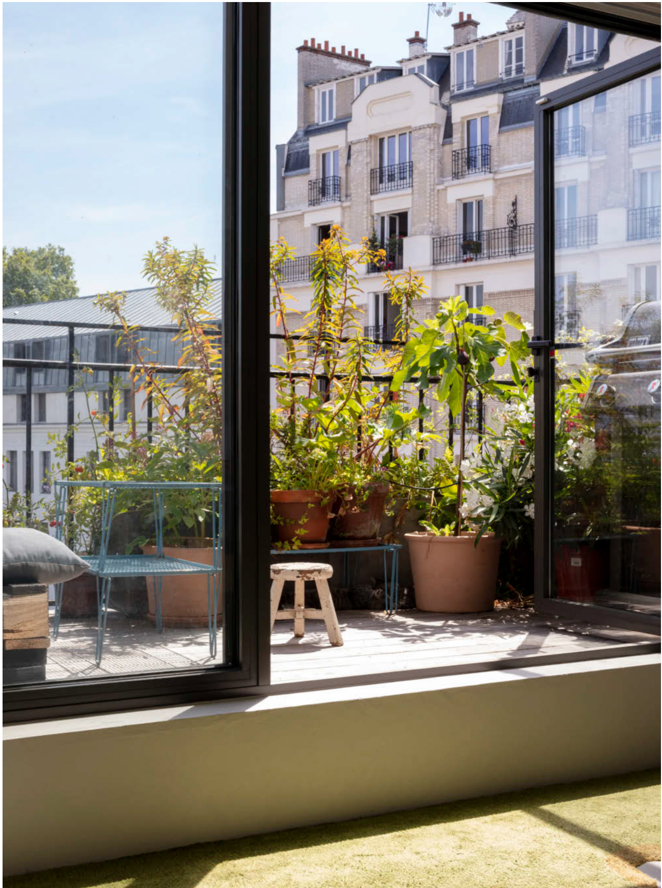
La chambre parentale est prolongée d'une terrasse aménagée en un modeste jardin suspendu rappelant la végétation des campagnes. Le tapis plain vert renforce ce sentiment.