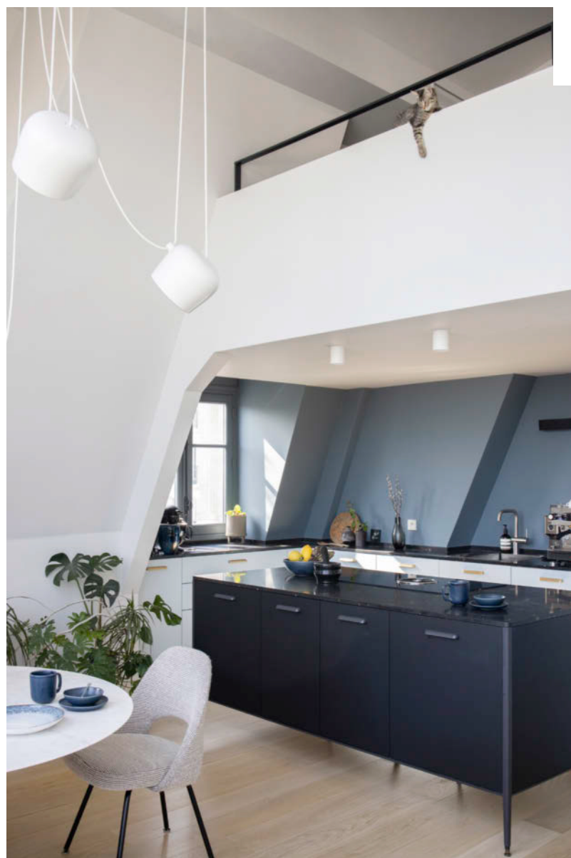
L'îlot de cuisine est surmonté d'un plan de travail en granit Luna da Agata. Contre le mur, des modules Ikea avec des façades de Superfront. CI-CONTRE Autre angle de la salle à manger, avec verrière et oculus. Le dressoir vintage a été remis à neuf.