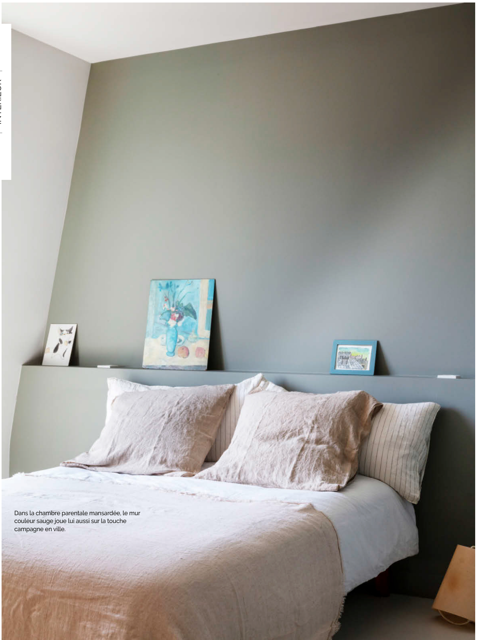
Dans la chambre parentale mansardée, le mur couleur sauge joue lui aussi sur la touche campagne en ville.